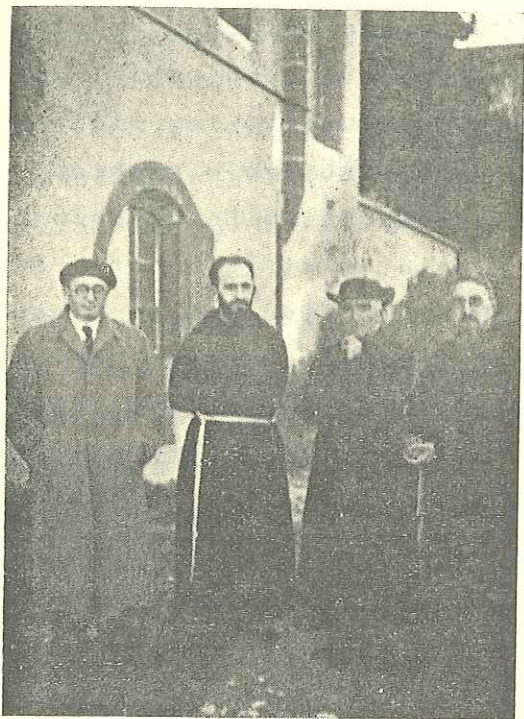
Orixe, Ataun-go Bonipazio Aita, Olabide eta Aita Donostia. (Toulouse-ko Kaputxinoen komen- tuan, 1938. urtean)

verbos del haber, ni el verbo haber auxiliaba a verbos del ser. Todavía en BN. conservan la separación rigurosa de los dos auxiliares. Todos los vascos conservamos la distinción perfecta de sujeto cero para verbos del ser y sujeto -K para verbos del haber; pero excepto en BN., usamos mal v.g. jan izan dut=soy solito comer en vez de he solito comer. Por lo contrario pecan franceses y españoles, sobre todo los españoles, diciendo "ha muerto" por "es muerto", "ha venido" por "es venido". Tienen aún otra anomalía: no conjugan ni pueden hoy conjugar el verbo ser sino auxiliado del verbo haber. Sabemos que seré, sería, proceden históricamente de ser-he, ser-hía. Ser he es abreviación de "de ser he" o he de ser, como lo prueba el dicho popular atribuido a los cartujos: "Hermano, morir tenemos", morir habemos, morir hemos,